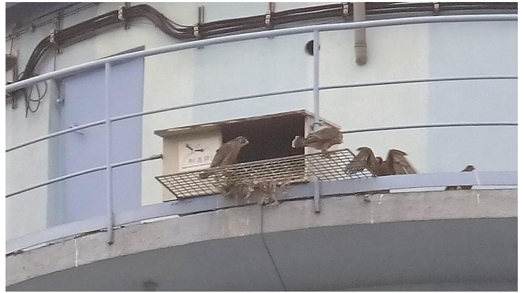
27. Mai 2018 = F6, HKW-Niederrad: 4 Jungvögel