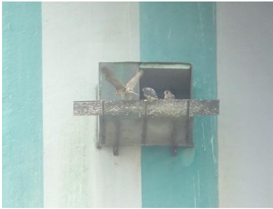
27. Mai 2018 = F2, EVO-Offenbach: 3 Jungfalken