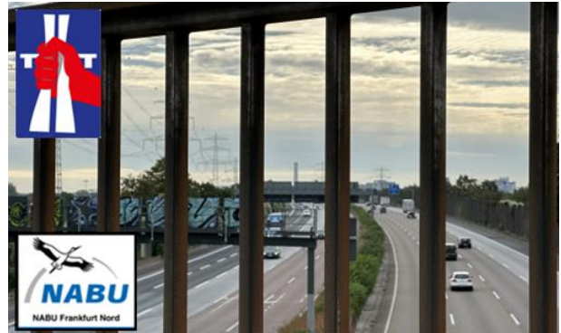
Die A5 in Frankfurt

Durchführung: BUND KV Frankfurt mit dem Bündnis Verkehrswende Ffm u. NABU Ffm Nord