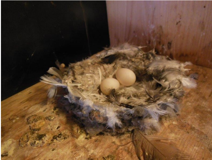
2-er-Gelege im „eigenen“ Napf-Nest

Die Nistplätze Nr. 23 bis Nr. 28 wurden im April 2005 eingebaut.