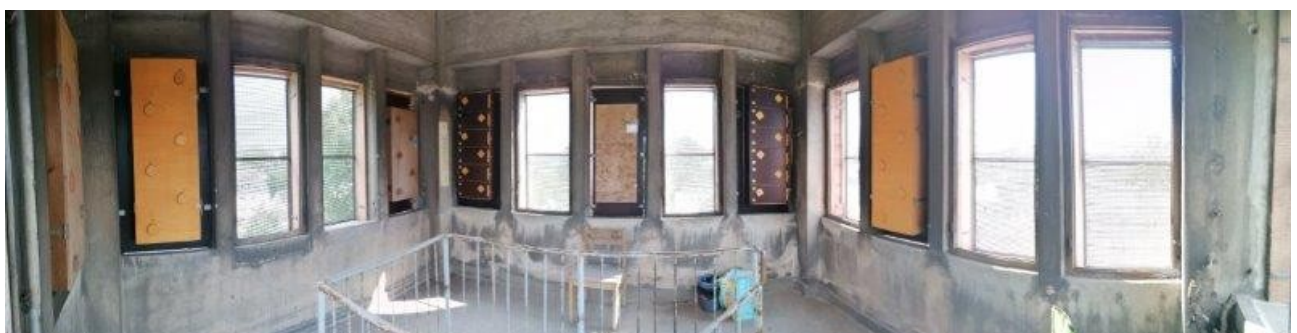
Panorama mit den sieben „Nist-Schränken“