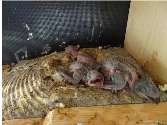
3 Nackt-Junge in einer Schwegler-Nistschale