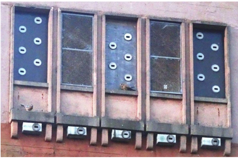
rechts und links: 2 neue Nistkasten-Einheiten. Hier, sehr klein zu sehen: links: Eichelhäher und mittig: Turmfalke